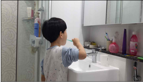
양치가 미흡한 부분은 더욱더 꼼꼼하게 양치하기