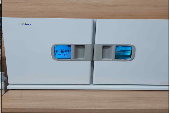
반납 후 물품 소독