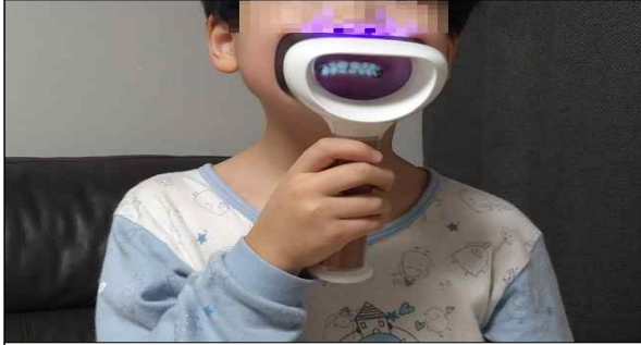
양치 후 치아세균 확인하기