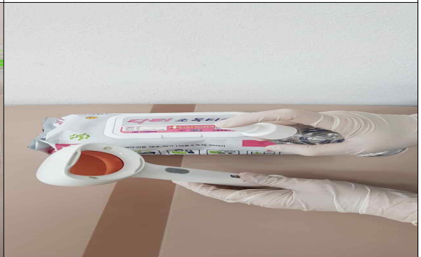
반납 후 물품 소독