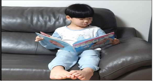
구강 교육 도서 읽기